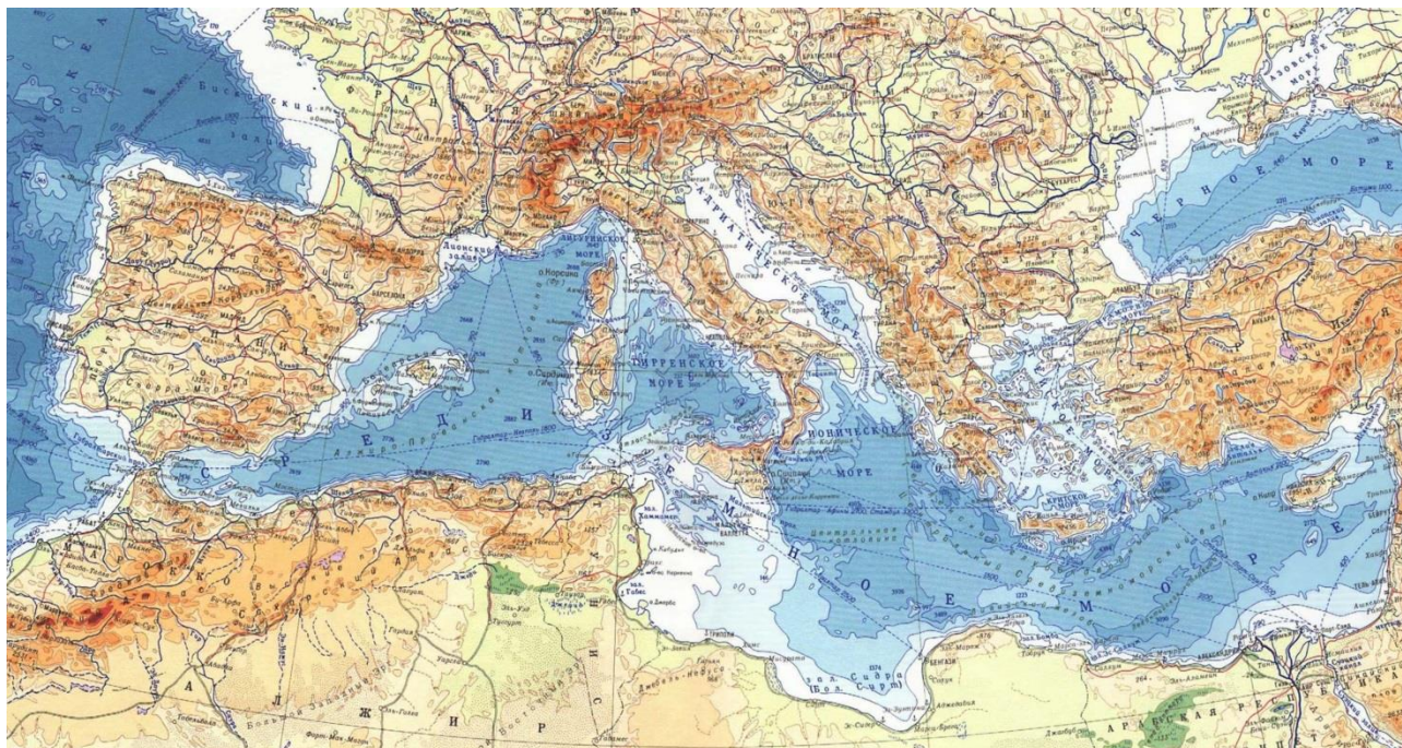
Рис. 2. Атласский хребет в Средиземном море [7]

Атлантида – это остров с горно-равнинной местностью, прямоугольной/овальной формы, оказавшийся полностью под водой. Заметим, что, согласно древнегреческому историку и географу Геродоту, в Ливии в 50 днях от египетских Фив располагалась гора Атлант, жителей вокруг которой звали атлантами [2, IV, 181-184]. Этот район был связан с Атласскими горами. Но именно район Атласский хребет (продолжение одноименных гор) и Африкано-Сицилийский порог, разделяющий Средиземное море на западную и восточную части, [3] оказался под водой (рис. 2).