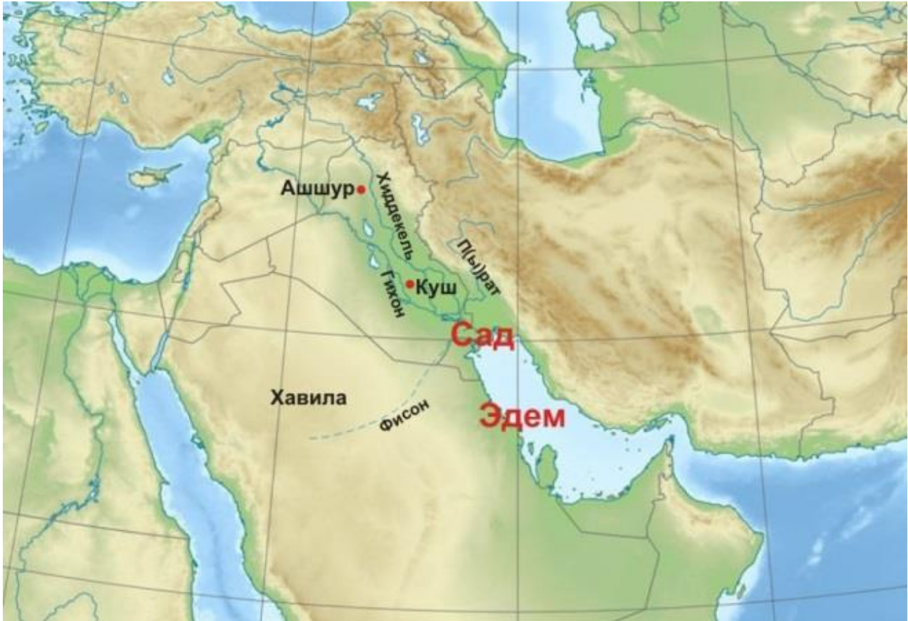
Рис. 2. Примерная схема расположения библейских рек, Эдема и Райского Сада

водой или превратившись в болотную низину. Причем первоначально северная часть современного Персидского залива могла выглядеть как река-прототип нынешней Шатт-эль-Араб [4, с. 415], в которую и впадали упомянутые в нашем исследовании библейские реки.