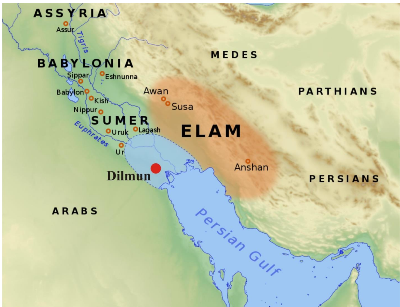
Рис. 2. Расположение земли Дильман [9].

Так локализуется место зарождения шумерской цивилизации – загадочный Дильмун (рис. 2).